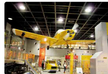
青少年科学館見学 (H29.10.28)