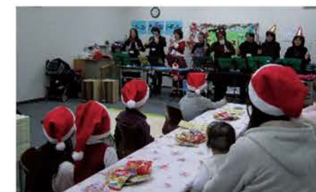
クリスマス会での演奏

親御さんが相談などを行っている間、子供達はボランティアスタッフと一緒に、ハンモックに揺られたり、大きなシャボン玉を作ったり、木工工作で汽車を作ったりと普段出来ないような遊びを経験しました。スタッフは、臨床心理士・保育士・司法書士・音楽療法士などで、それぞれが専門性を活かしながらサポートしています。この日は音楽のセッションも無く、体力勝負でしたが、はじけるような笑顔の子供達と、それをみつめる親御さんの優しい表情にふれさせていただき、スタッフとしてやりがいを感じる一日となりました。