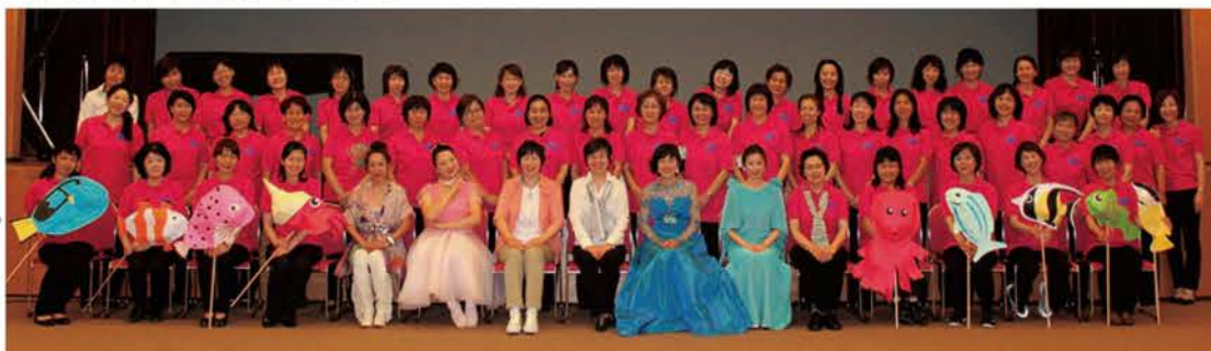
セラピスト達の“笑顔”

7月20日兵庫県看護協会ハーモニーホールにおいて、兵庫県との共催による東日本大震災復興支援の第2回「音・きずなコンサート」が開催されました。会場に入ると穏やかに流れるピアノの音色がお客様をお迎えします。さあコンサートの始まりです。まずはヘルマンハーブとギターによる『たなばたさま』メロディーが流れ出すと会場から歌声が重なっていきます。思わず立ち上がって指揮を始める女の子。ゆったりとした柔らかな音色に会場が包まれていきました。楽器体験コーナーでは「やりたい人！」の声に「ハイ！」とたくさんの声があがります。楽器に触れるその手からはワクワク、ドキドキが伝わってきます。「私も触りたいんですけど?」と遠慮がちに手をあげた少女の女性は、ヘルマンハーブを奏でて少女のような笑顔に！次にピンクのドレスを着た白鳥(?)が会場の人々を南の島へと誘って行きます。登場したカメハメハ大王と一緒に「カメハメハ！」と声を合わせて気分は最高！席でうずうずしていた男の子は、舞台の前へと飛び出していきました。次に流れてきたのは『いつも何度でも』柔らかなトーンチャイムの奏でるハーモニーはなんと心地よいこと。