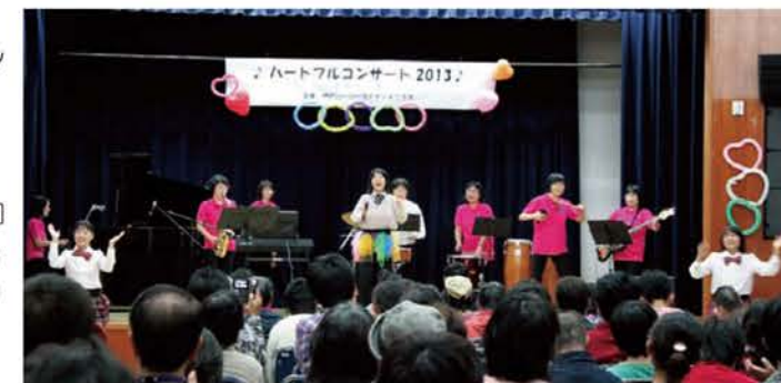
笑顔あふれる楽器演奏とダンス

11月4日、兵庫県中央労働センター大ホールにて、障がいのある方々を対象に神戸ハーバーライオンズクラブ主催のコンサートが開催されました。[笑顔で元気]をテーマに、オープニングは『パロック・ハウダウン』で打楽器を鳴らしながら会場を音楽療法士達が進行しました。『どんぐりきのおいも』では身体活動を会場一体となって行い、オーボエによる『風笛』や『となりのトトロ』(ヴァイオリンも加わり)の鑑賞をし『ヘビーローテーション』と『ラ・バンバ』(参加者はエッグマラカスで参加)の楽器活動を行い、最後は全員で『ともだちになるために』を歌いながら「きみときみと」でお互いに手合わせをしました。最後にアンコールで『ラ・バンバ』の演奏を始めると、参加された方が次々舞台上に集まり療法士達と一緒に踊り、会場に居る皆が一体となり「笑顔」になってコンサートを終了しました。